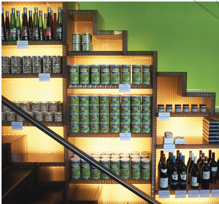
PoS & Möbel/ PoS & furniture Sushibar - Denmark clear-PEP® UV PC