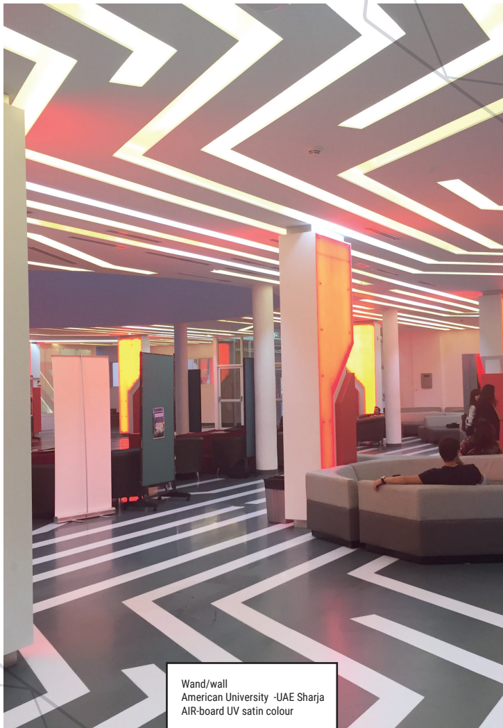
Wand/wall American University -UAE Sharja AIR-board UV satin colour