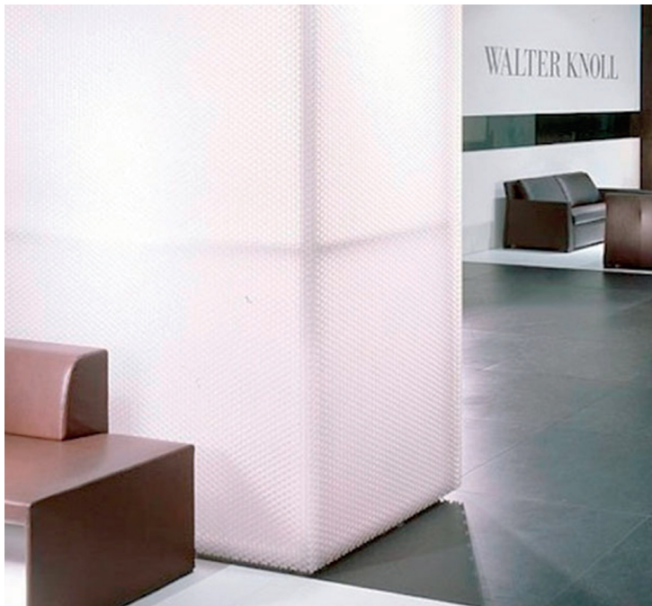
Messebau/booth construction Orgatec – Walter Knoll, Germany clear-PEP® UV satin